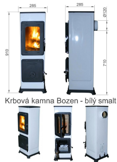
Krbová kamna Bozen - bílý smalt