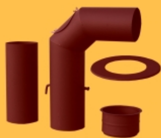
Sada Kouřovodů DN150 hnědá