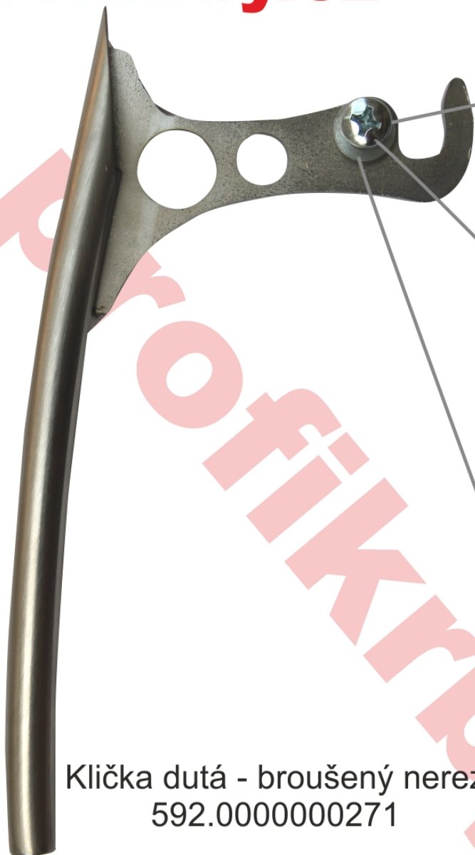
Klička dutá - broušený nerez 592.0000000271