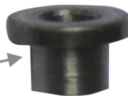
Podložka pro kličku s osazením 592.0000000565