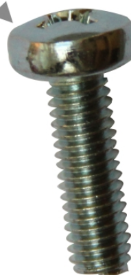
Šroub pro kličku 592.0000000610