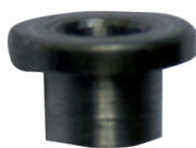
Podložka pro kličku s osazením 592.0000000565