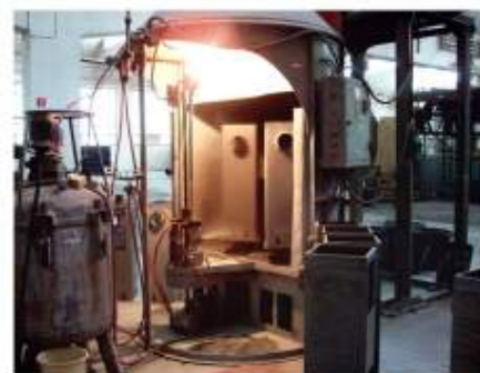
Pískování povrchu, galvanické pokovování a smaltování