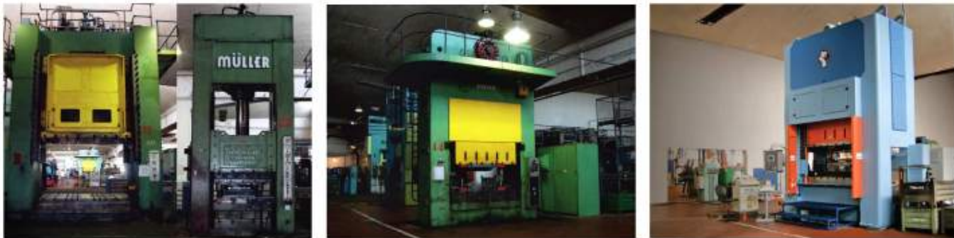
Lisování - stříhání a hohybání, hluboké tažení a protlačování