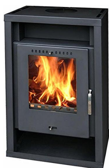
KRBOVÁ KAMNA GENT