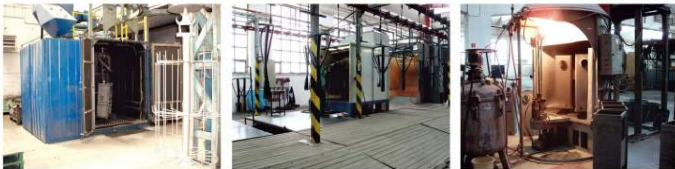
Pískování povrchu, galvanické pokovování a smaltování