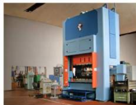
Lisování - stříhání a hohybání, hluboké tažení a protlačování