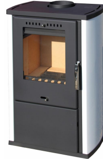
KRBOVÁ KAMNA COLMAR