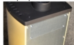
Výstup teplého vzduchu