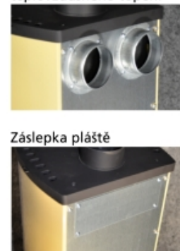
Napojení na rozvod teplovzdušného topení