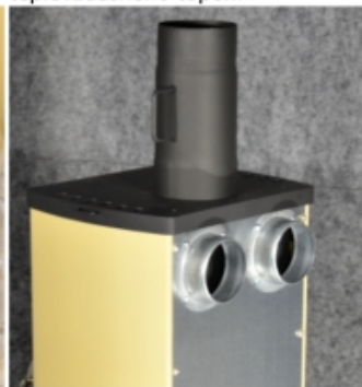
Připojení na komín a rozvod teplovzdušného topení