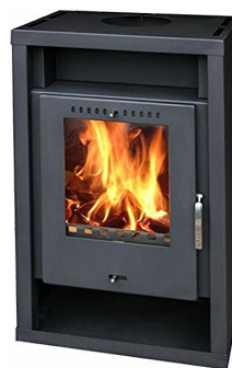
KRBOVÁ KAMNA GENT