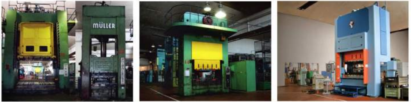
Lisování - stříhání a hohybání, hluboké tažení a protlačování